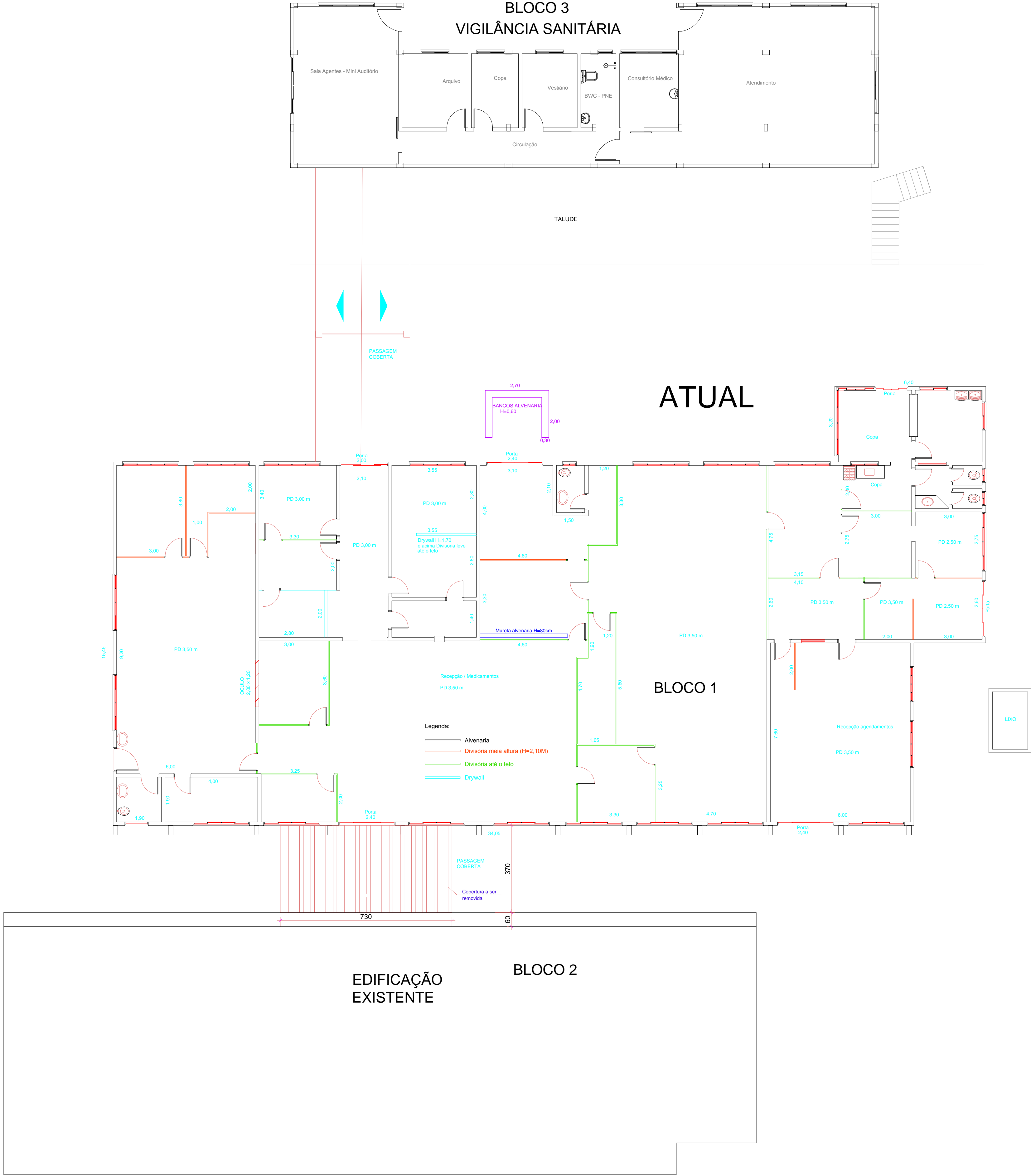
PLANTA BAIXA - EXISTENTE Escala 1 / 100