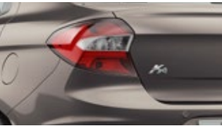
Cinza Copenhagem (perolizada)