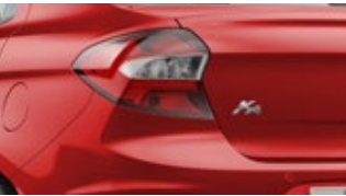
Vermelho Arpoador (sólida)