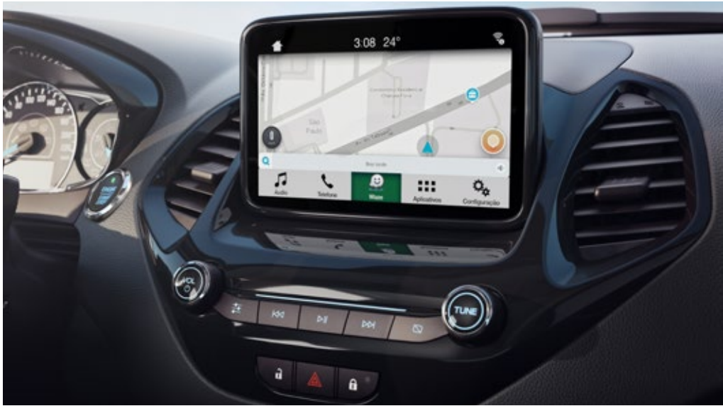
Sync®3 com tela de 6,5" e Waze na tela do carro para usuários de Android e Apple iOS