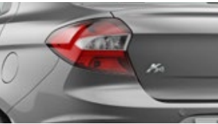
Prata Dublin (metálica)