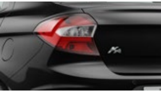
Preto Bristol (perolizada)