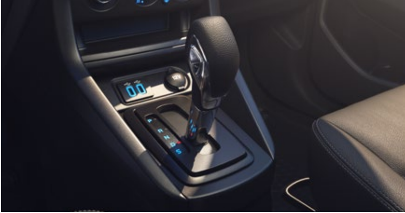
Nova Transmissão Automática