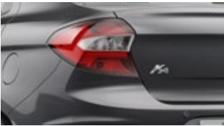
Cinza Moscou (perolizada)