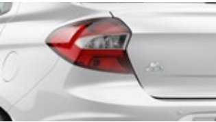
Branco Ártico (sólida)