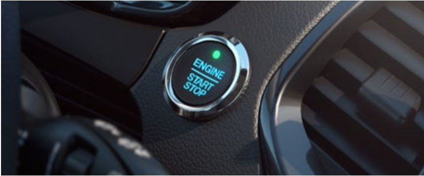
Ford Power – Partida sem chave