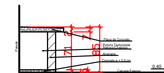
Corte A-A (abrigo ár comprimido) Esc: 1/25