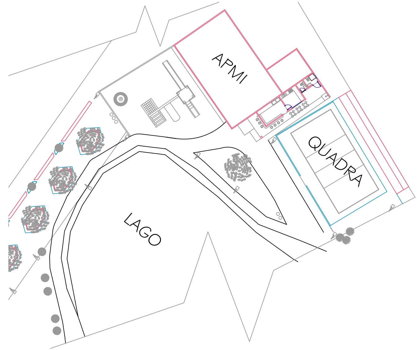
Planta de localização Esc.: 1/200