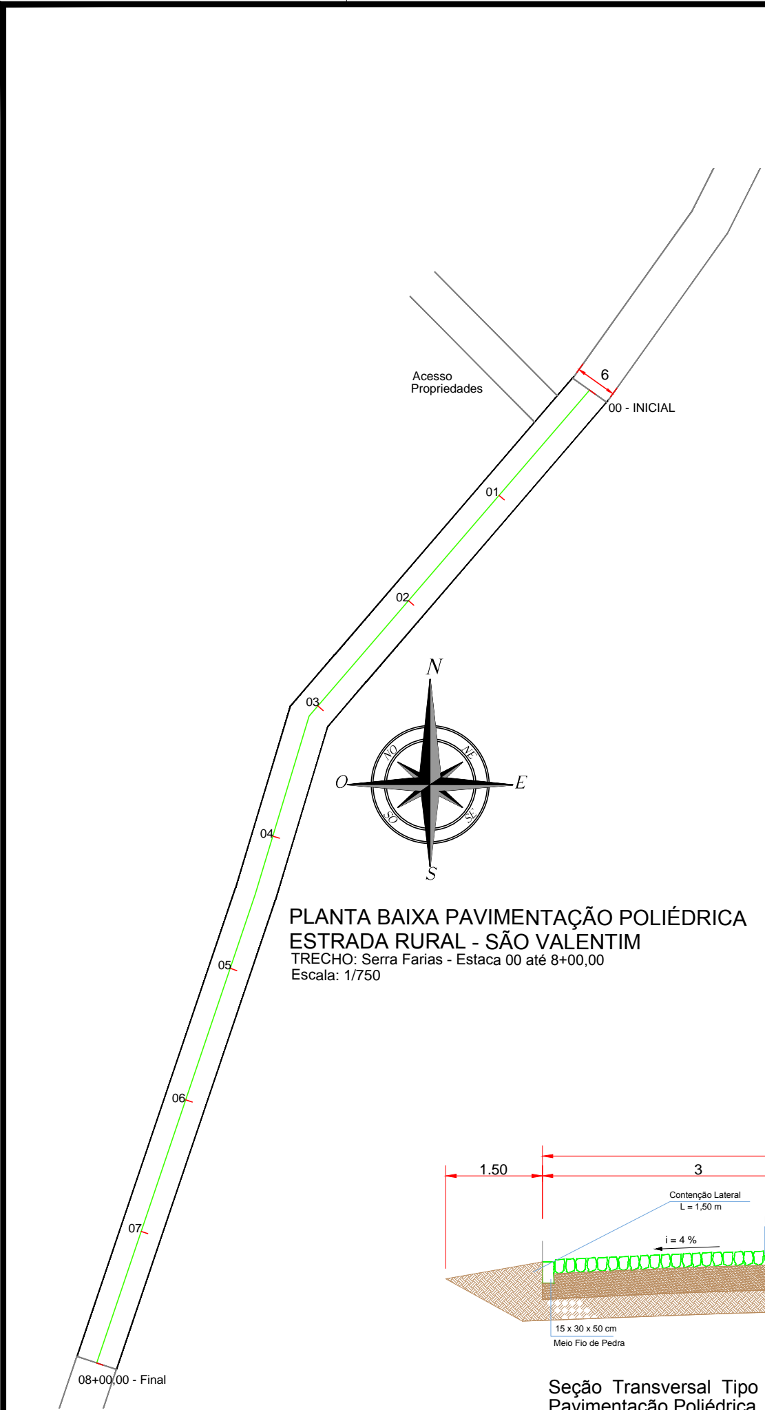
PLANTA BAIXA PAVIMENTAÇÃO POLIÉDRICA ESTRADA RURAL - SÃO VALENTIM TRECHO: Serra Farias - Estaca 00 até 8+00,00 Escala: 1/750