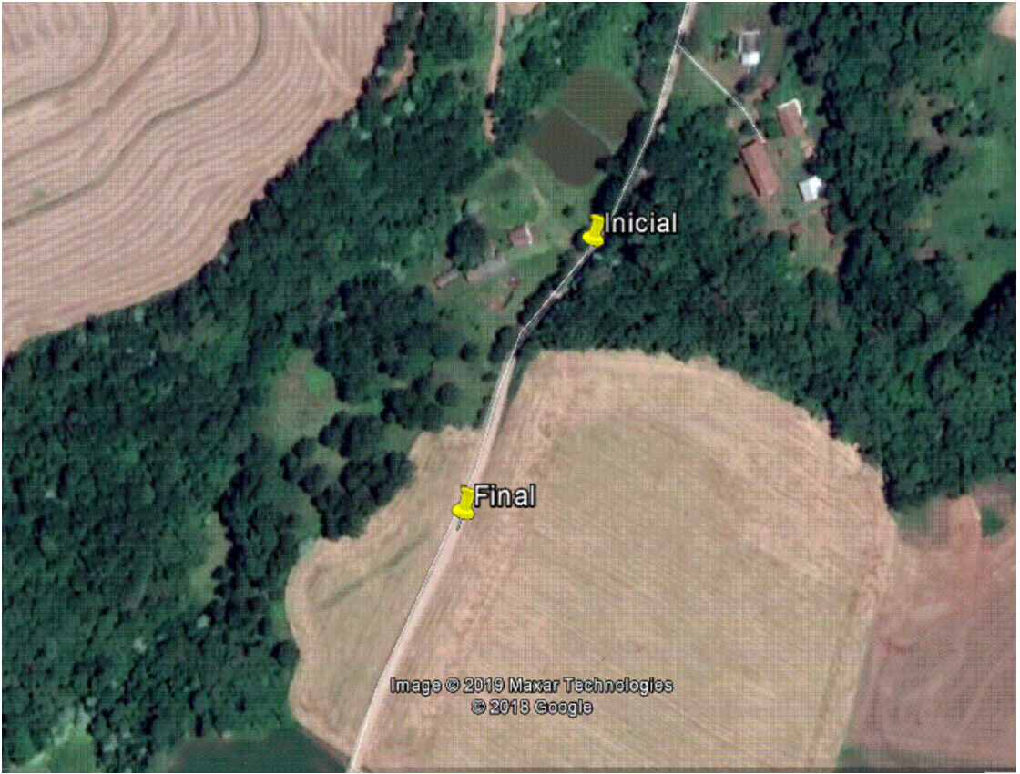
PLANTA DE LOCALIZAÇÃO - ESTRADA RURAL - SÃO VALENTIM Trecho: Serra Farias Escala: sem