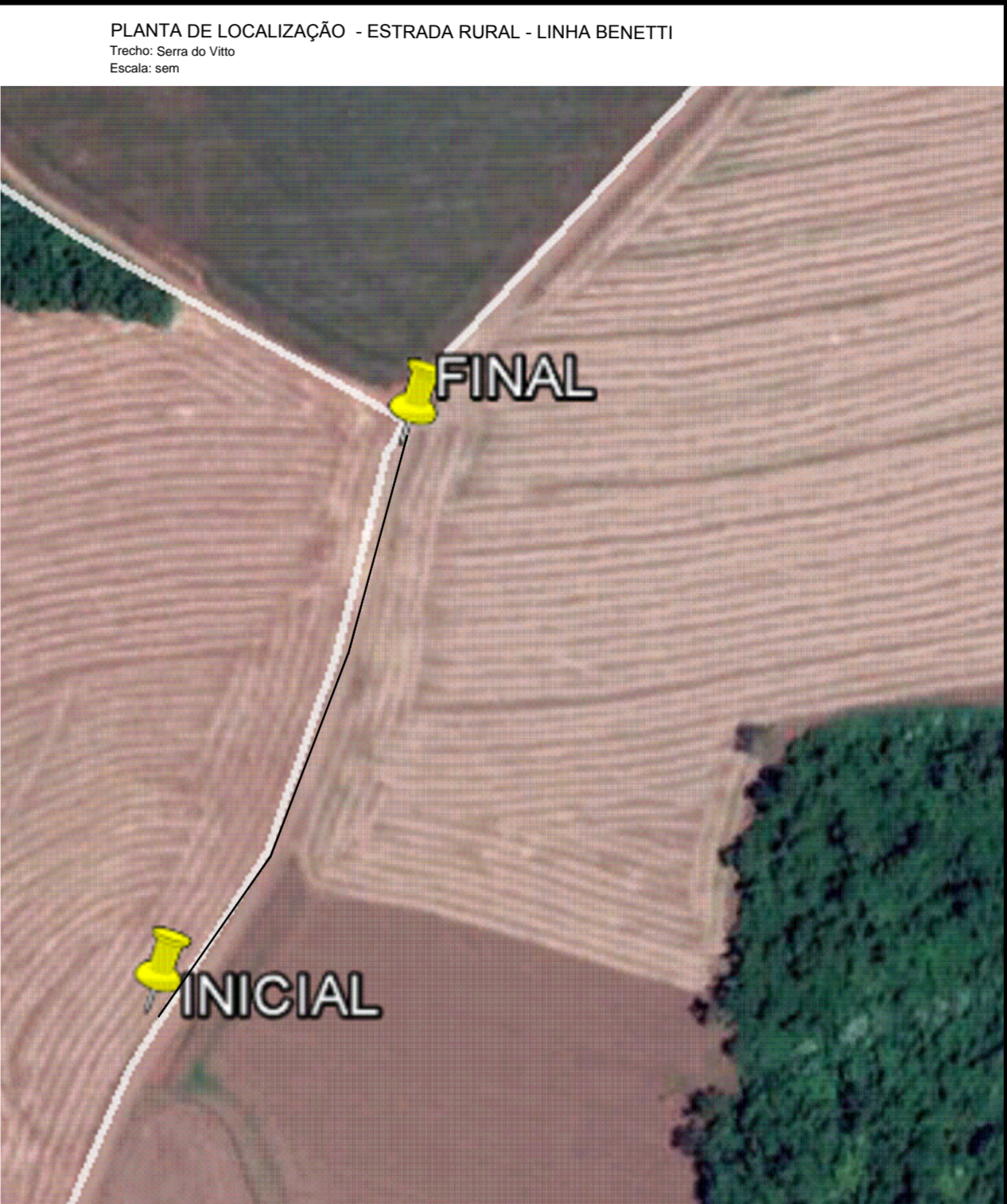
PLANTA DE LOCALIZAÇÃO - ESTRADA RURAL - LINHA BENETTI Trecho: Serra do Vito Escala: sem