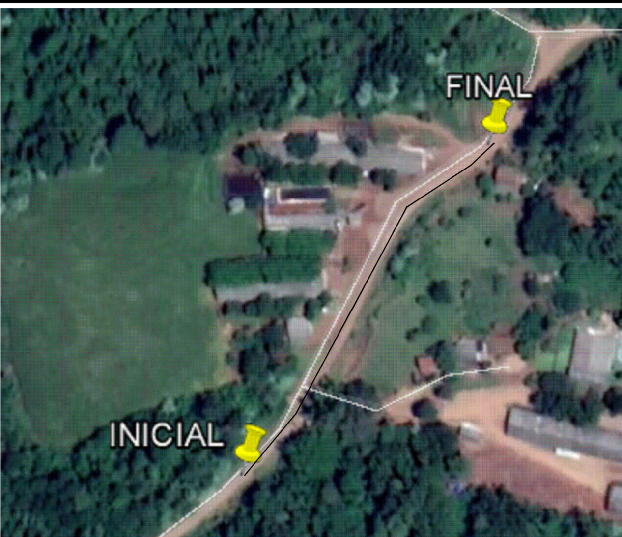
PLANTA DE LOCALIZAÇÃO - ESTRADA RURAL - LINHA BENETTI Trecho: Serra Benetti Escala: sem