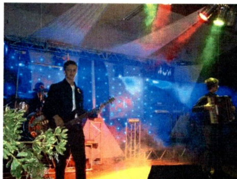
Pato Branco – PR