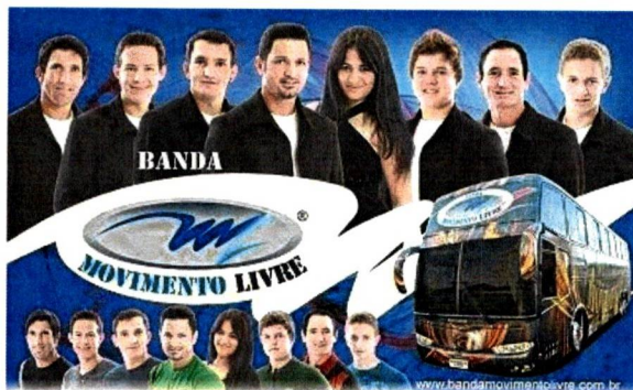
Cartaz da Banda Movimento Livre